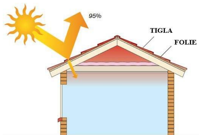
AVANTAJ ÎMPOTRIVA RAZELOR U.V.